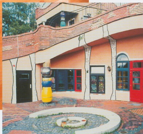
Wärmeschutz setzt der Fantasie keine Grenzen.

Wer sein altes Wohnhaus nach dem Niedrigenergiestandard modernisieren möchte, kann unter bestimmten Bedingungen Förderprogramme nutzen: Informationen dazu beim BAW, Bundesamt für Wirtschaft, Frankfurter Straße 29 - 31, 65760 Eschborn